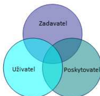
Obrázek č.1 Triáda – aktéři procesu komunitního plánování